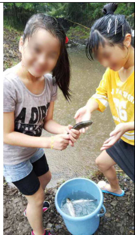
小鹿野町で鱒つかみをする 仲町会の子供