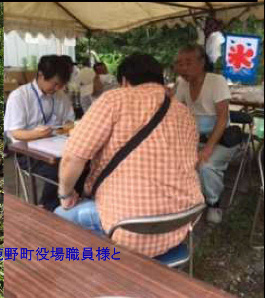
左：沢の横に設置されたテント